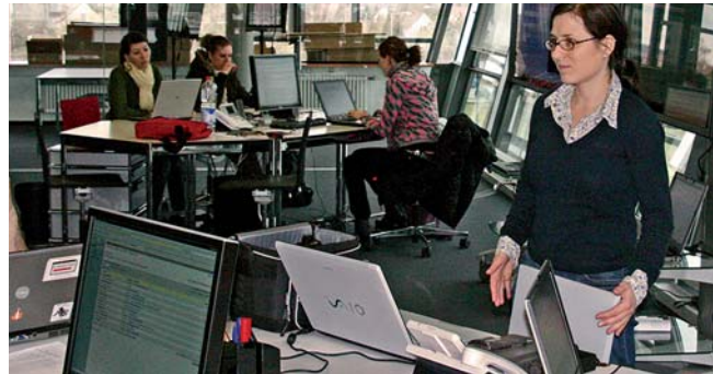
Themendiskussion mit dem CvD

Zu Beginn eines Semesters erfolgt dementsprechend mehr Input durch die Professoren, schrittweise wird dieser durch