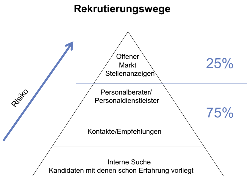
Abb. 2: Rekrutierungswege

Wer über ein gutes Netzwerk verfügt, erfährt bereits von Stellen, die noch nicht offiziell ausgeschrieben sind oder wird sogar direkt angesprochen. Viele Unternehmen bitten ihre Mitarbeiter ganz konkret um Kandidatenvorschläge. Daher ist der Kontakte zu ehemaligen Studienkollegen hier eine gute Möglichkeit ins Gespräch gebracht zu werden. Kontakte lassen sich auch sehr gut auf Fach- oder Rekrutierungsmessen knüpfen. Bei der Kontaktaufnahme wird die eigene kurze Vorstellung von entscheidender Bedeu-