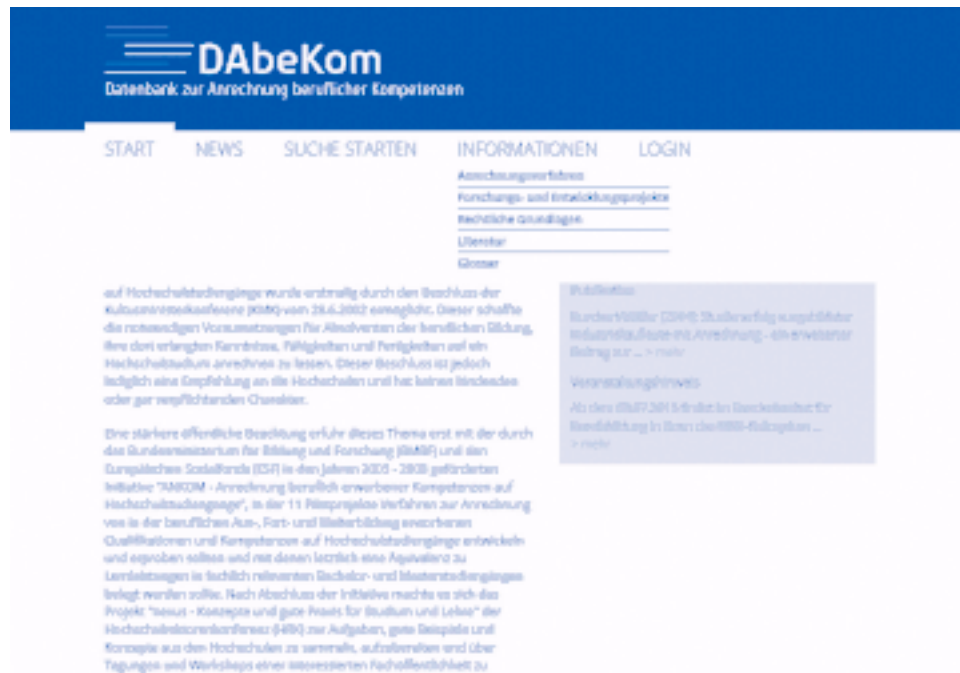
Abb. 1: Screenshot Startseite DAbeKom

auf Studiengänge an deutschen Hochschulen zusammengestellt und abrufbar gemacht (vgl. Abb. 1).